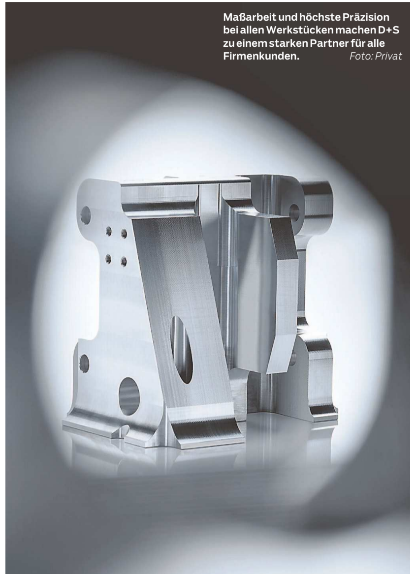
Maßarbeit und höchste Präzision bei allen Werkstücken machen D+S zu einem starken Partner für alle Firmenkunden.