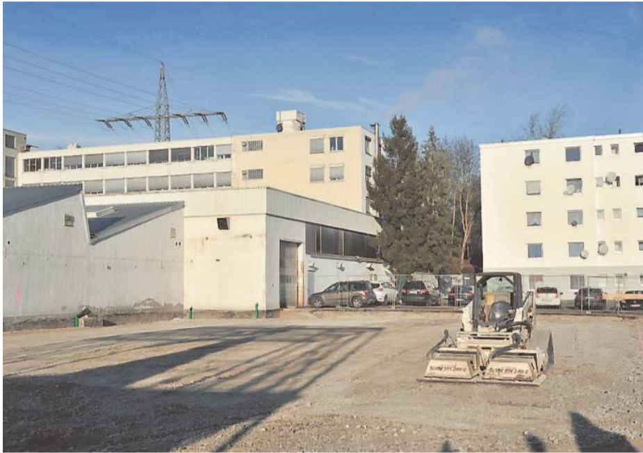
Noch kann man es nicht erahnen, doch schon bald soll auf diesem Areal die neue Fertigungshalle von D+S Werkzeugbau stehen.

CNC-Maschinen. Zudem hat sich der Bedarf an Tieflochbohren in den letzten Jahren immer weiter erhöht. Aus diesem Grund wurde bereits eine hochmoderne „Auerbach“-Tieflochbohrmaschine für 2017 bestellt. Für weitere Informationen zur Firma und Details zu den einzelnen Maschinen findet der Kunde Auskunft auf der neu gestalteten Homepage unter www.ds-werkzeugbau.de .