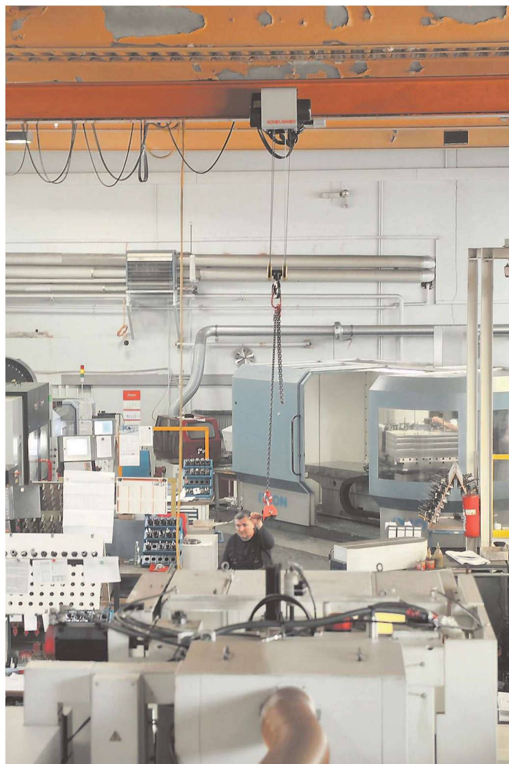
Ein Blick in die Werkhalle von D+S Werkzeugbau.